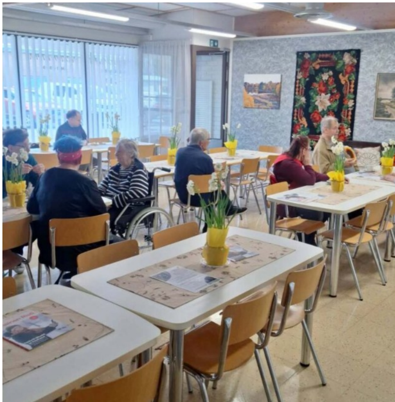
Kuva 4. Ensimmäinen Nakkilan ystäväkahvila 11.4.2025.

Ystäväkahvila yhdistää kohtaamispaikkatoiminnan, edistää osallisuutta, ehkäisee yksinäisyyttä ja lisäksi edistää terveyttä. Kahvila kuuluu ystävätoiminnan, terveyden edistämisen, mutta myös kokonaisvalmiuden alle osaston toiminnassa.