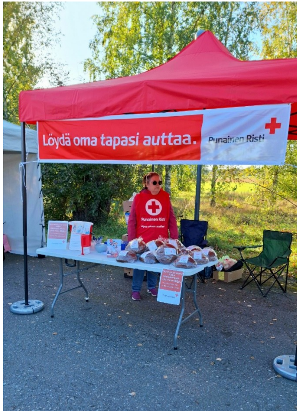
Kuva 5. Nälkäpäivälimpun myyntiä Nahkiaismarkkinoilla.

Osasto osallistui Nahkiaismarkkinoille 20.9.2025 Järjestimme arvannon ja myimme Nälkäpäivän limppua sekä lisäsimme osaston näkyvyyttä.